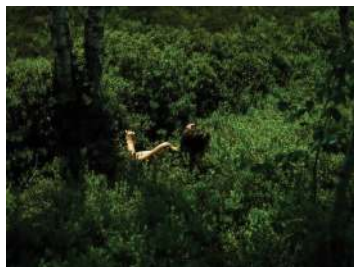
Bain de jouvence / 2018

Ses travaux cherchent à saisir la beauté fragile de l'existence humaine, son regard sensible lui permet d'accéder à une forme d'intimité souvent révélatrice des enjeux de notre société. Plusieurs fois récompensé par le Swiss Press Photo Award, Guillaume Perret a réalisé de nombreuses expositions et installations (galerie Focale de Nyon, Théâtre de l'Orangerie de Genève, médiathèque Alpha d'Angoulême, Espace Nicolas Schilling et Galerie à Neuchâtel, Festival International du Livre d'Art et du Film de Perpignan). Plusieurs ouvrages retracent ses projets dont AMOUR (Editions ACT, Genève, 2023).