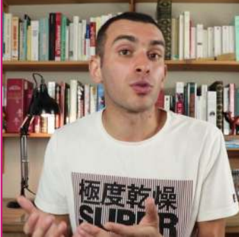
© Le Dôme du Rocher: symbole d'un islam conquérant ? (voir page 7)