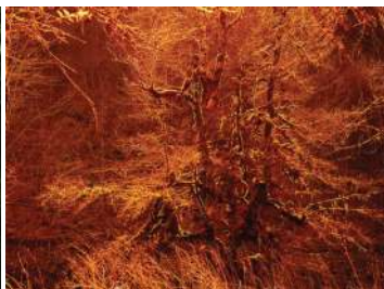
Feu végétal / 2020